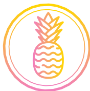
Dany Mey @danymh

Bonjour Mavic, petit retour sur ce livre qui sera un Best-seller ! Whaou ! Il est magnifique, magique et referme une tonne de travail. Je n'ai pas pour habitude de lire des livres de développement personnel. Cependant, pour le peu que j'ai pu lire auparavant, celui-là détrône les autres. Pas besoin de relire les paragraphes 5 fois pour les rapporter à notre vie, c'est clair ! L'histoire de Tigresse et sa famille m'a plongée dans mon vécu pour pas mal d'histoires. Avec mes post-it je vais revenir pour travailler ces histoires qui m'ont touché en plein cœur. Ton inspiration, tes worksheets ne peuvent que nous embarquer dans un voyage express vers la version à 1 million de dollars de nous-même. Merci.